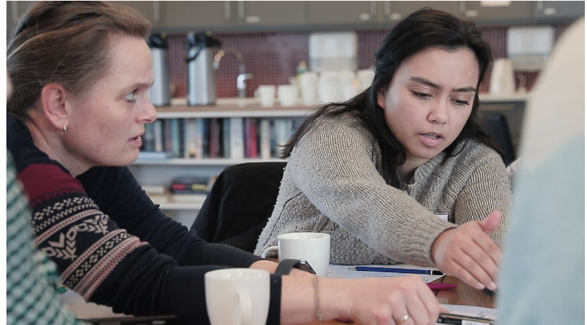
Foredrag – diskusjoner – praktiske aktiviteter