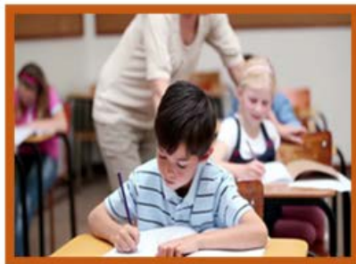
Egen lykkes smed