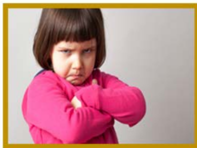
Prins og Prinsesse